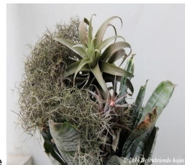
Clavel del aire